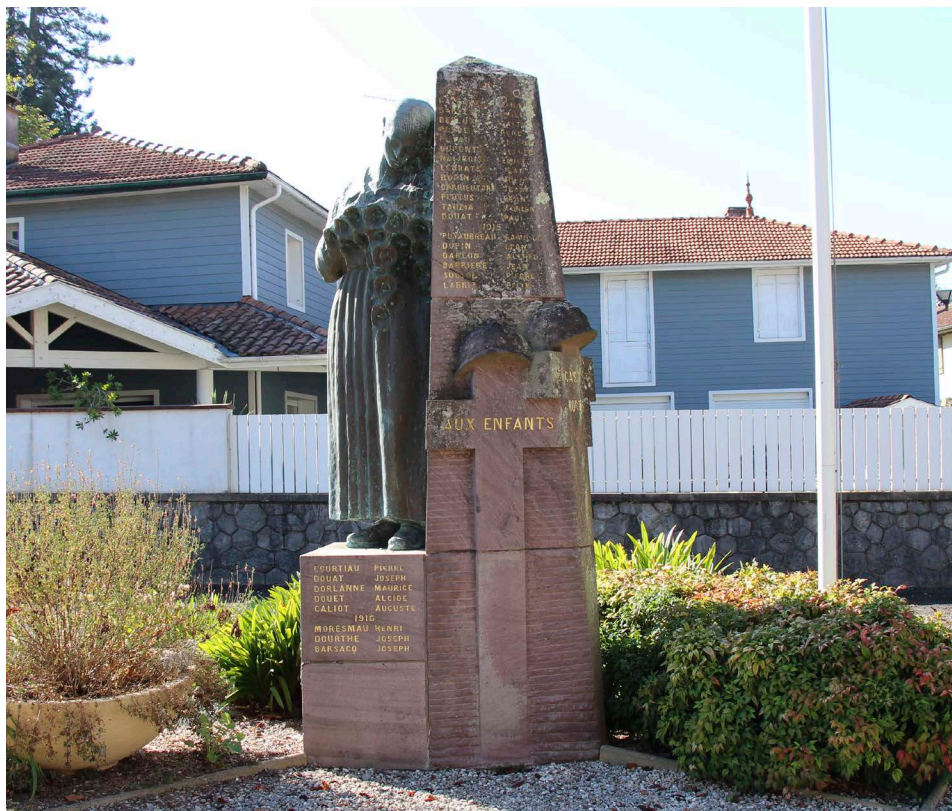
Un monument aux morts original, la dame aux coquelicots.

La silhouette de cette jeune femme pleurant les morts de la Grande Guerre est familière à tous les Castésiens. Mais connaissez-vous son histoire ?