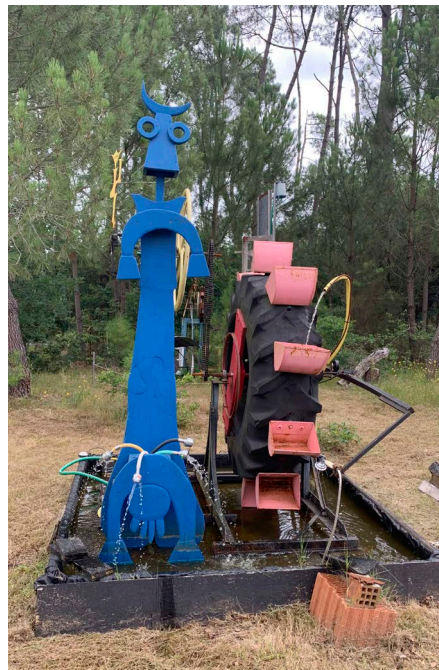
'La vache bleue', une œuvre d'Olivier Louloum.

Les créations de cet artiste leur sont déjà connues, puisqu'il est le concepteur de la fontaine de la grenouille que l'on trouve près du Barrat. Il interviendra auprès de trois classes de l'école primaire, pour diriger un atelier de création d'une œuvre commune, qui sera par la suite implantée sur le parcours du patrimoine.