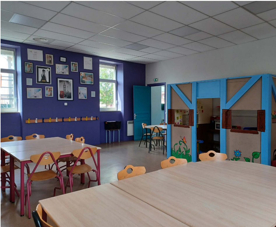
Les couleurs des salles rénovées ont été choisies par les enfants.

L'accueil de loisirs municipal, qui accueille les jeunes de 3 à 17 ans, a été entièrement rénové. Plus pratique, plus confortable, il sera également moins coûteux à chauffer.