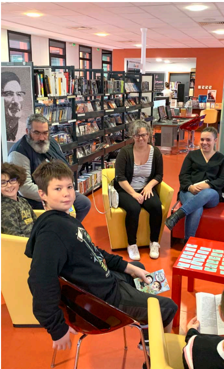
Un club de lecture jeune public est né.

Lecture, spectacles, animations, expositions, il y aura de tout et pour tous les publics, cette année encore à la ludo-médiathèque de Castets.