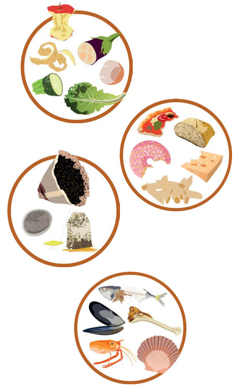
LE COMPOSTAGE INDIVIDUEL