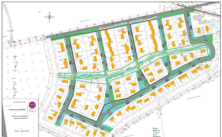
Le plan du futur lotissement.

sur toute l'opération, pour pouvoir proposer, in fine, un tarif raisonnable. Ce qui, dans un contexte de tension immobilière constante, de hausse des taux d'intérêt et des coûts de construction, est appréciable. D'autant plus qu'une municipalité n'est pas forcément « adaptée » à ce genre d'opération. Celle-ci requiert en effet des compétences spécifiques, un budget annexe, une comptabilité séparée et une trésorerie solide pour financer achats, études et aménagements... jusqu'aux premières ventes !