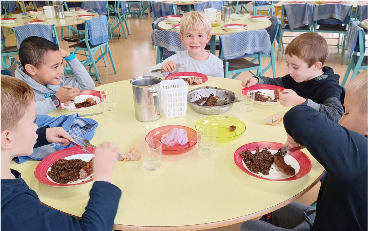
Pour beaucoup de familles, le prix a diminué, pas la qualité !